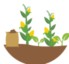
Plantas y cultivos